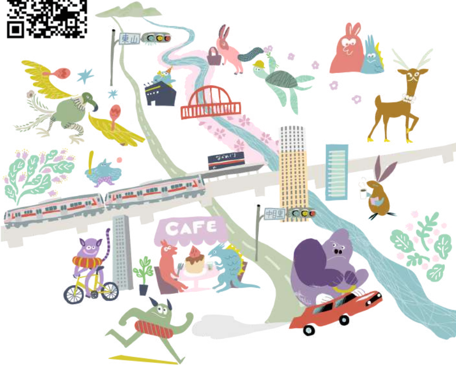
保育室の壁には中目黒の街がファンシーに描かれ、病気のおさんが少しでも楽しい気分になるように想いがこめられています！

ロコクリニック中目黒が新店舗に移転して1ヶ月がすぎました。ありがたいことに移転後もたくさんの患者さんにお越しいただき、新しく導入したシステムや機器も皆さんの協力と理解のおかげでうまく運用され感謝するばかりです。