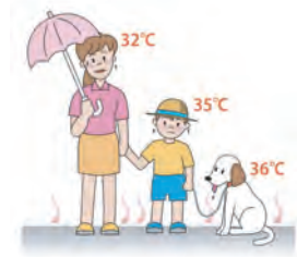
大人の32℃は子どもの35℃です！

今年は進行し続ける温暖化の影響もあり例年よりも暑さが厳しく、世界の平均気温や水温も記録的な数字を示しています。あまりの暑さに熱中症リスクが高く、お子さんを日中時間帯に外に連れ出すのも躊躇ってしまいますね。子どもは体温調整機能が未熟なため、発汗をうまくできず熱がこもりやすい、水分が多く外気温の影響を受けやすい、地面からの照り返しを受けやすいなどのリスクがあります。水分をしっかり取ったり、帽子を被ったり、こまめに日陰で休んだり、色々対策していると思いますが、本日おすすめの前法は、こまめに霧吹きで頭や体表を濡らすことです。さらにハンディの扇風機やうちわがあれば併用することもおすすめ。気化熱(蒸発熱=水が蒸発する時に周囲から熱を奪う現象)を活用した対策は熱中症の初期治療の基本でもあり、こまめな霧吹きをぜひお試しください！